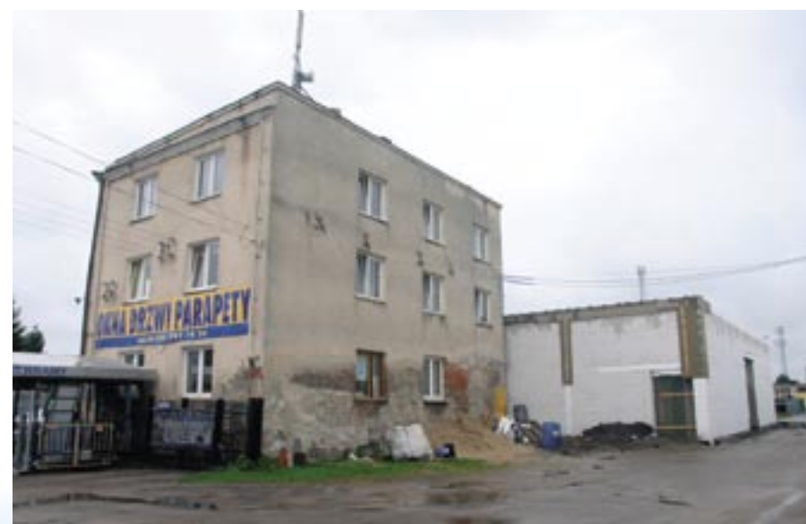
Młyn z dostawianym sklepem Biedronka