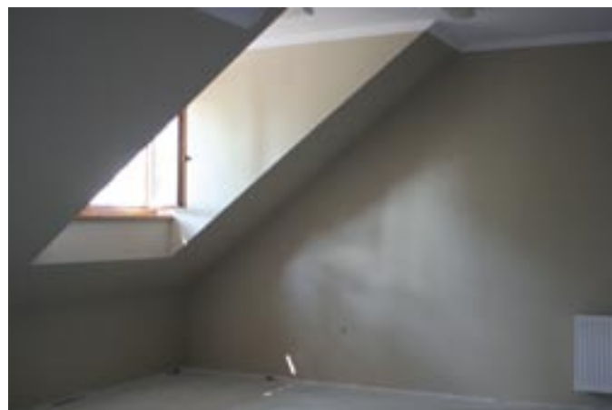
Nowe pomieszczenie w Ośrodku Kultury w Serocku