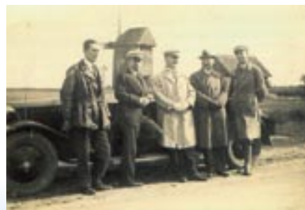
Wiatrak przy ul. Polnej w latach 30. XX w.

wej Niemcy nakazali rozebrać dwa wiatraki był on jedynym zakładem młynarskim w Serocku. Pozostawał pod zarządem przybyłego z Węgrowsa volksdeutscha Antona Hinza. Po wojnie starosta pułtuski przekazał młyn miastu, a to Gminnej Spółdzielni „Samopomoc Chłopska”, dalej zwanej GS. Młyn funkcjonował jednak nienajlepiej, dochodziło do sabotażu, zaniedbań i pijaństwa, miał też miejsce spór po-