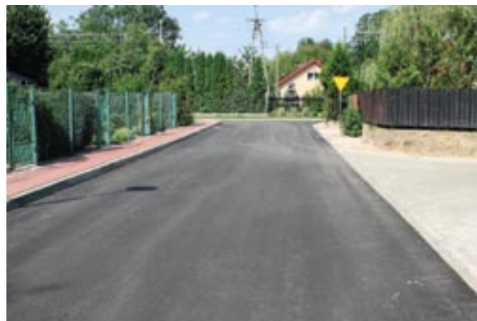
Nowo wybudowana droga w miejscowości Dębe

Większość realizowanych inwestycji dotyczy infrastruktury drogowej, edukacyjnej, sportowej oraz kultury.