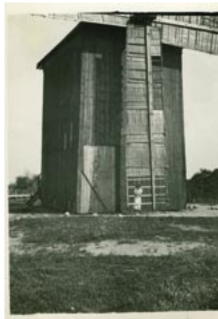
Wiatrak przy ul. Polnej