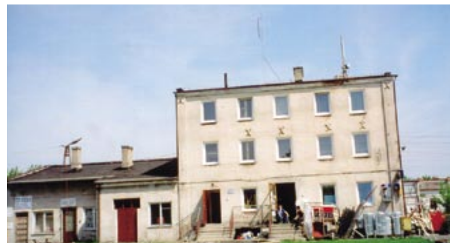
Budynek dawnego młyna w 2003 r.

tereny prywatne w sąsiedztwie młyna, by zbudować magazyny i składy materiałów. Prowadził m.in. sprzedaż węgla, nawozów sztucznych, pasz, maszyn rolniczych, materiałów budowlanych oraz innych wyrobów. Przy ciągłych brakach