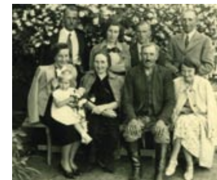
Rodzina Elmerów w latach 30-tych XX w.

w zaopatrzeniu i systemie przydziałów, było to miejsc męk dla wielu mieszkańców miasta i gminy, którzy musieli wy-czekiwać w wielogodzinnych, często nocnych, kolejkach by móc kupić węgiel, nawozy, czy materiały budowlane.