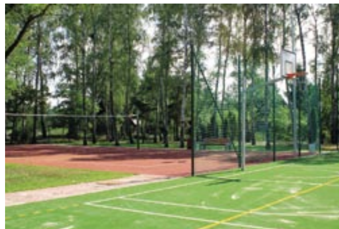
Boiska w Nowej Wsi

z trawy sztucznej przy stadionie miejskim w Serocku. Wykonano nowe ogrodzenie stadionu od strony wschodniej.