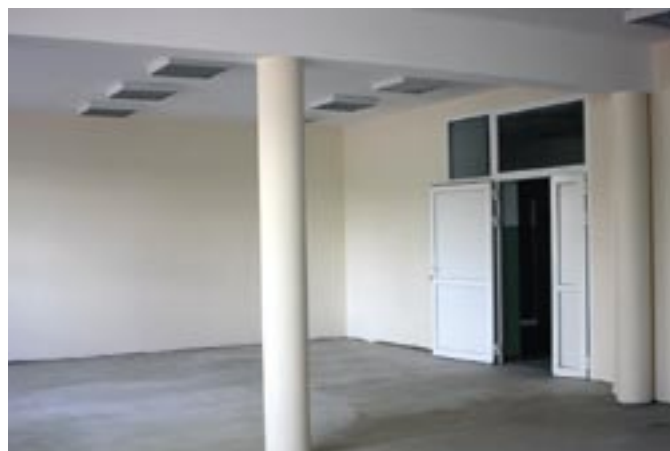
Nowe pomieszczenie w szkole w Woli Kiełpińskiej