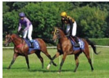
Wielki Damati występuje z nr startowym 18

Uważa on, że osiągnięcia Wielkiego Damatego są po prostu wielkie i dobrze świadczą o hodowli prowadzonej, od wielu lat