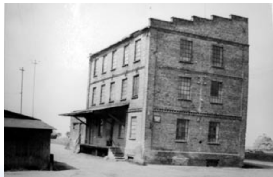
Młyn w 1958 r.