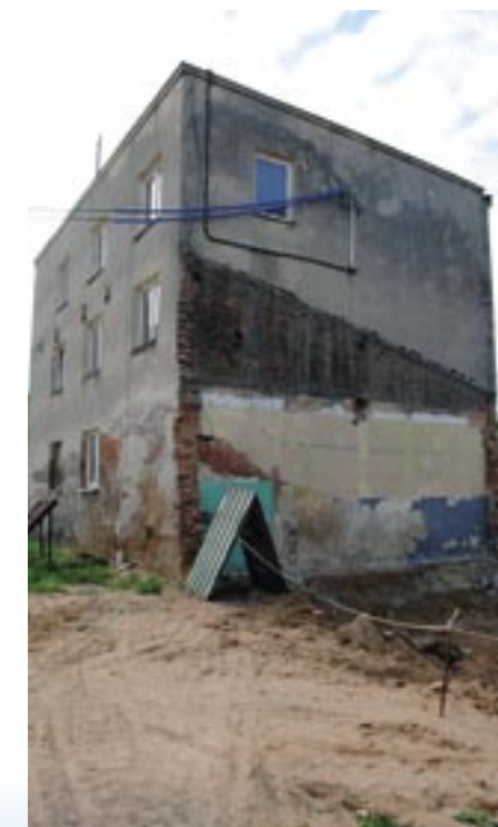
Zachodnia ściana młyna